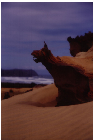
Písečný drak. Tam, kde byl písek zpěvněn sopečnými výrony, vytvářel zajímavé skulptury.