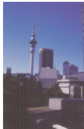
Auckland neuvěřitelně členitý: horizontálně mořskými zálivy a vertikálně 40 sopečnými pahorky. Centrum je však odpudivé.