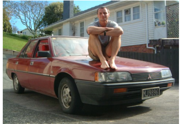
Obrázek 1 Dvanáctý majitel.