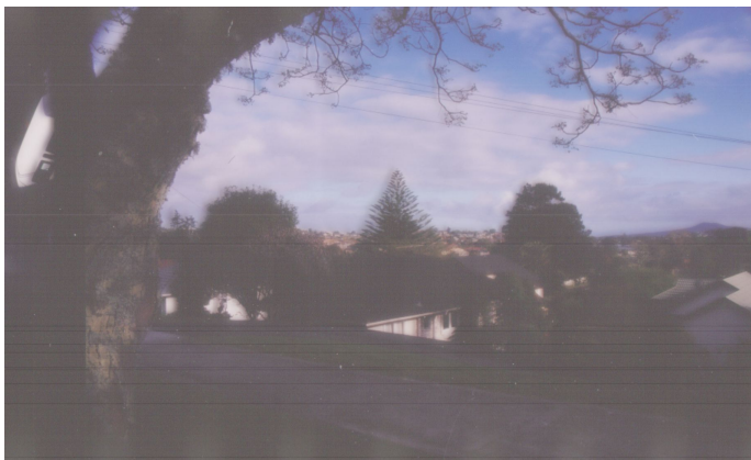
Gimelfarbovic dřevěný dům je pro Auckland typický.