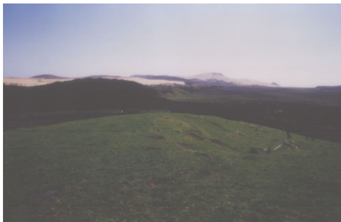
Pastvina, bažina, poušť a oceán.