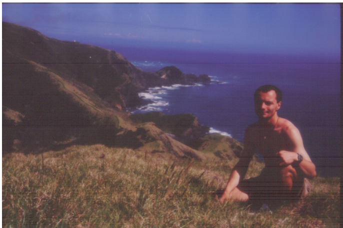
Nad Sundy Bay a před majákem na Cape Reinga (to je ta bílá tečka na orizontu).