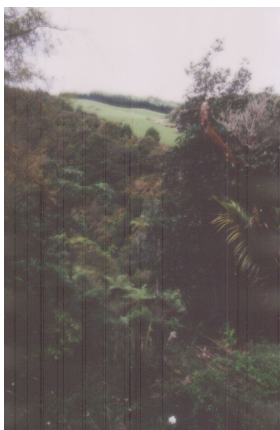
Džungle. Odbočí-li člověk z hlavní silnice, brzy dojde asfalt a cesta se začne kroutit pralesem.