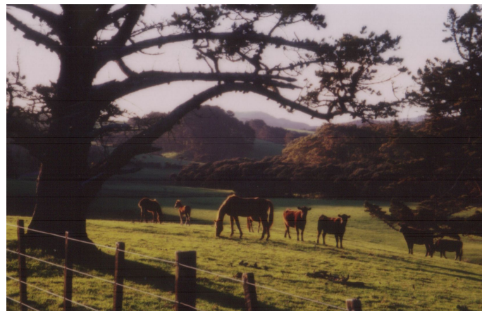
Cestou na sever se střídají pralesy, ovocné sady a hlavně pastviny.